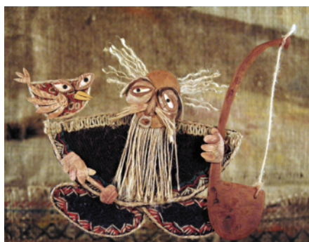
Le moineau et la graine de cotonnier