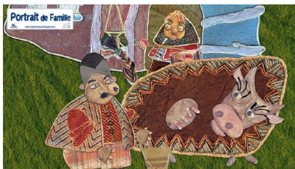
La citrouille qui roule