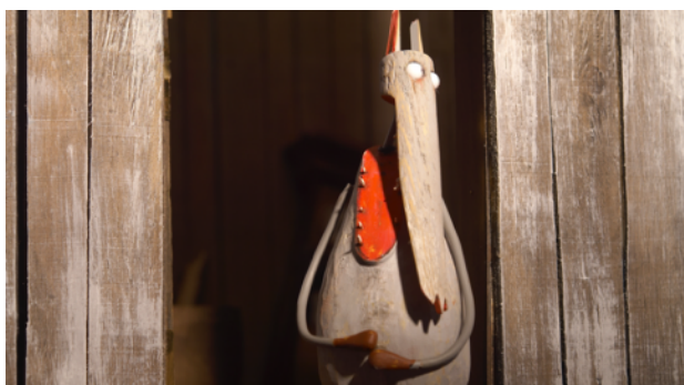
Les 7 chevreaux , Ismael Mon, 2010