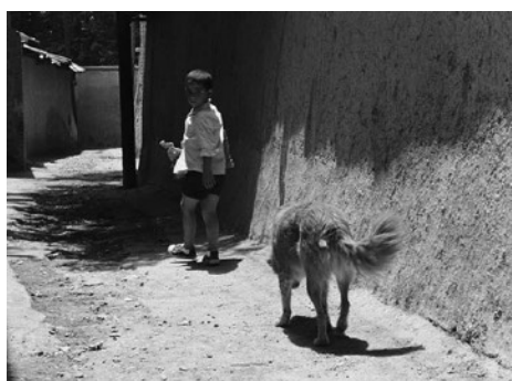
Le pain et la rue , Abbas Kiarostami, 1970