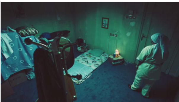
Sumiyati ira-t-ell en enfer ?, Meshal al Jaser