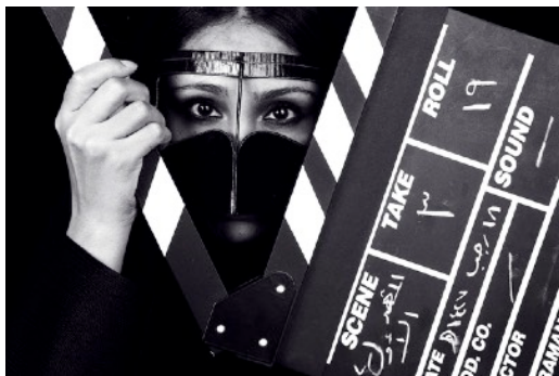
Je suis ... cinéaste