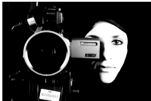
Je suis ... productrice de TV