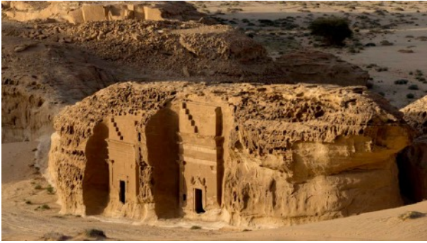
Tombes nabatéennes, site d'AlUla, Yann Arthus-Bertrand