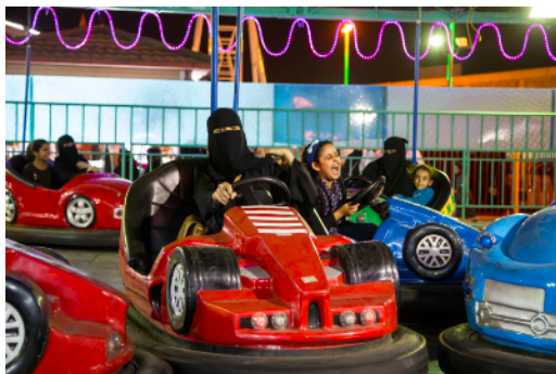
Never Never Land