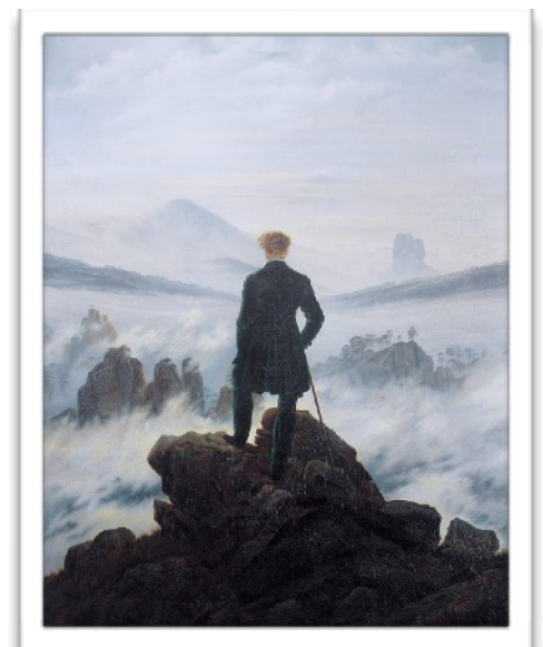
Le voyageur au-dessus de la mer de nuages, Caspar David Friedrich, 1818