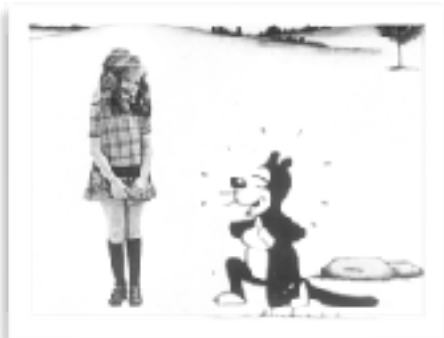
La maison hantée