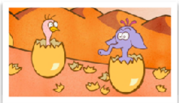
La poule, l'éléphant et le serpent