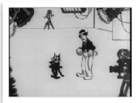
Félix in Hollywood