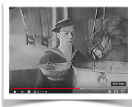
La croisière du Navigator, Buster Keaton, 1924