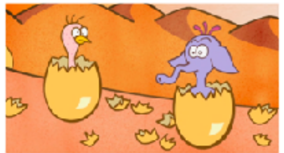
La poule, l'éléphant et le serpent