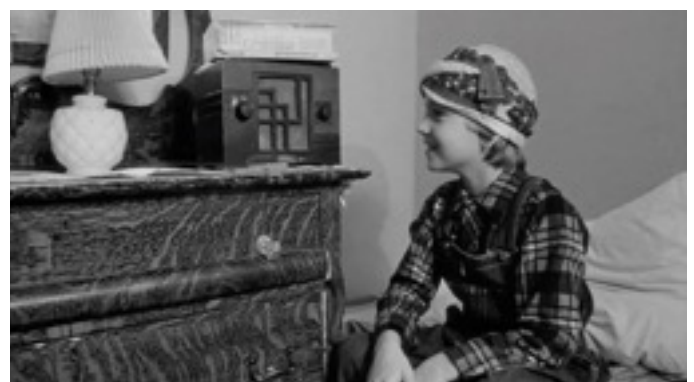
Photogramme de Paper Moon

Addie aime beaucoup les fictions radiophoniques, elle rit particulièrement au gag récurrent du placard en désordre. Gag mémorable du célèbre duo Fibber Mc Gee and Molly :