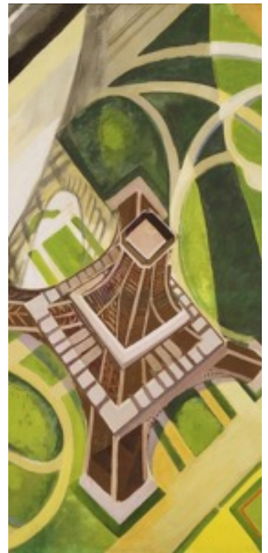
Tour Eiffel et jardins du Champ-de-Mars

http://collections.forumdesimages.fr/CogniTellUI/faces/details.xhtml?id=P112