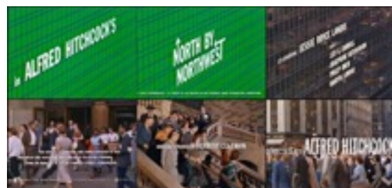
La mort aux trousses