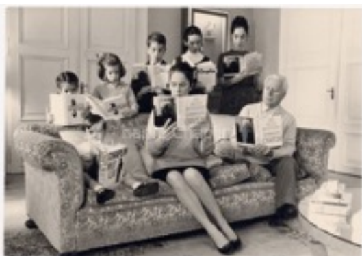
Toute la famille lit l'autobiographie de Chaplin, 1964