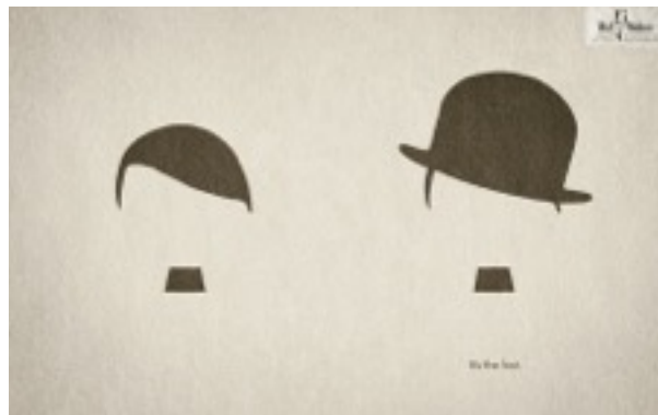
Publicité pour un chapeau, Hut