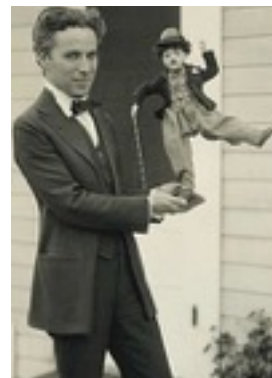
Chaplin avec une poupée Charlot, 1918