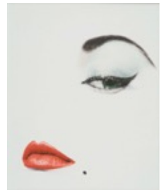
Couverture du magazine Vogue, Blumenfeld