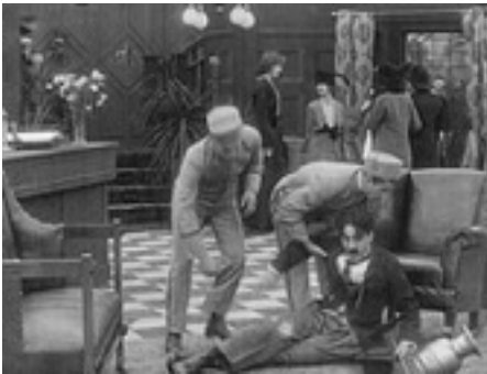
L'étrange aventure de Mabel , 1914