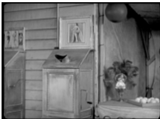
Photogramme du Cirque