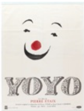
Affiche du film Yoyo