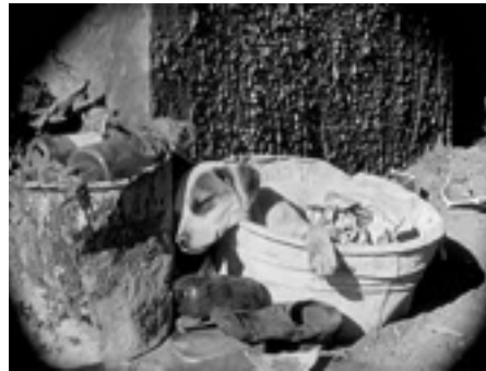
Une vie de chien , 1918