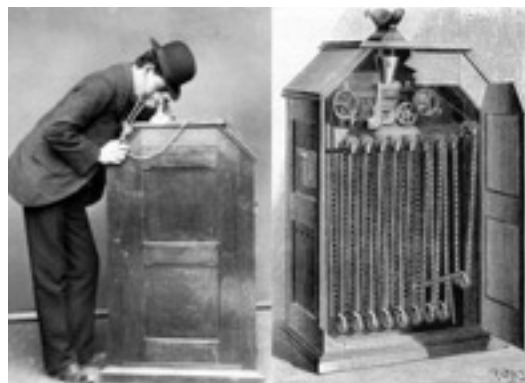
Kinétoscope de Thomas Edison, 1888