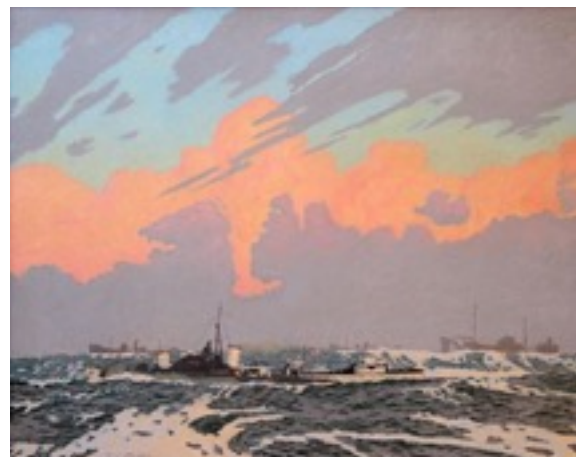
Charles Pears (1873-1958)