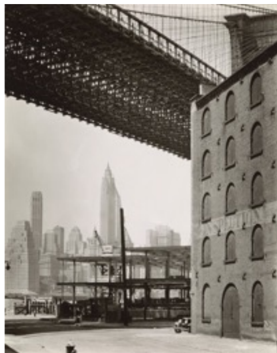
Brooklyn Bridge, Water and Dock Streets de Berenice Abbott , 1936