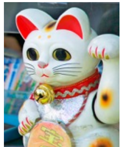
Chat : ねこ