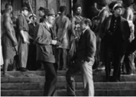
Schoedsack et Cooper pendant le tournage de King Kong

Au cinéma Jean Vigo de Gennevilliers le 25 mars 2017