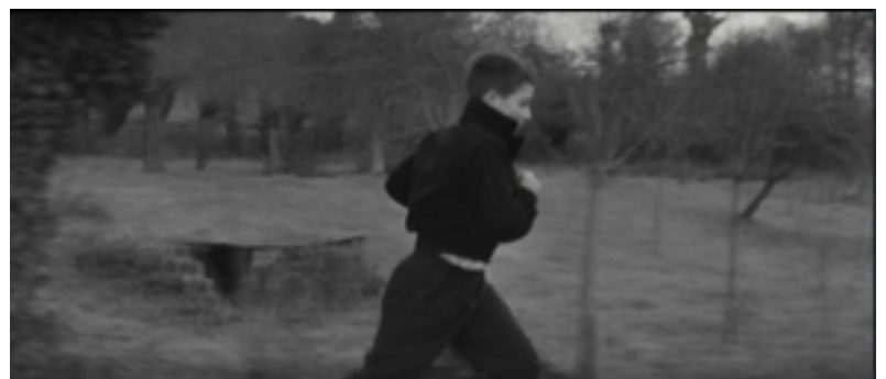
Les quatre cents coups de François Truffaut, 1959