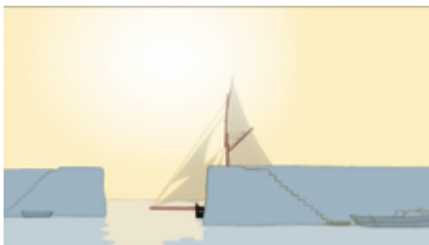
L'île de Black Mor de Jean-François Laguionie, 2003

http://www.cnc.fr/web/fr/college-au-cinema1/-/ressources/6180860