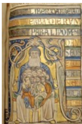
Abraham, bible de Souvigny, XII e