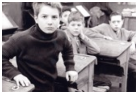
Les Quatre Cents Coups