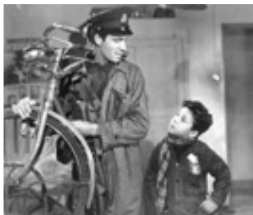
Le Voleur de Bicyclette