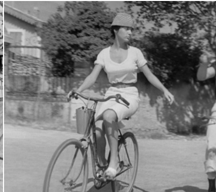
Les Mistons de François Truffaut, 1958