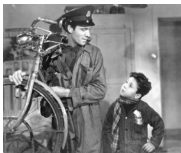
Le Voleur de Bicyclette