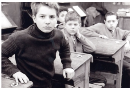
Les Quatre Cents Coups