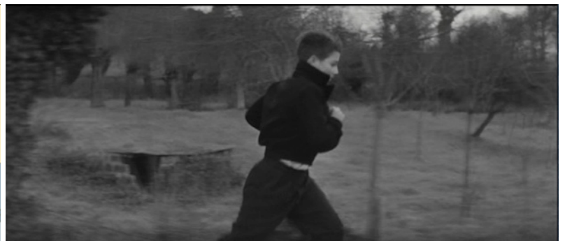
Les quatre cents coups de François Truffaut, 1959