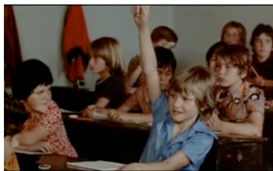
L'argent de poche de François Truffaut, 1976