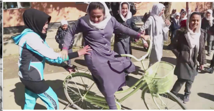
Les petites reines de Kaboul, Arte, 2016