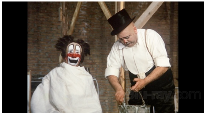
Photogramme des Clowns de Fellini