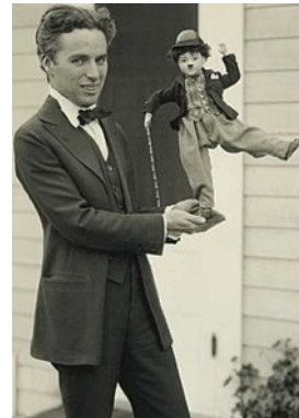
Chaplin avec une poupée Charlot, 1918