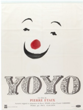
Affiche du film Yoyo