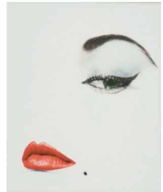
Couverture du magazine Vogue , Blumenfeld