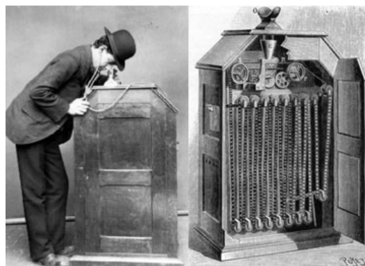
Kinétoscope de Thomas Edison, 1888

○ De Georges Méliès à Woody Allen, en passant par Charles Chaplin !