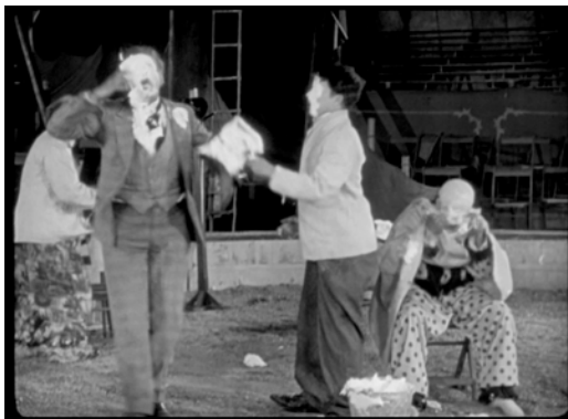
Photogramme du Cirque