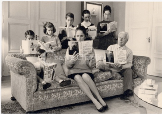
Toute la famille lit l'autobiographie de Chaplin, 1964