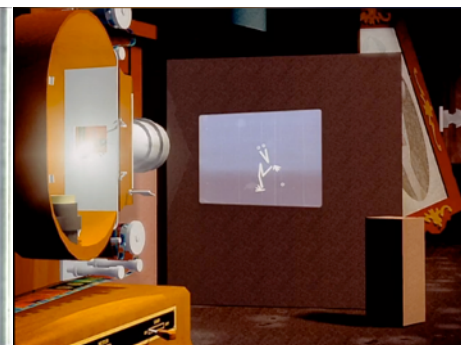
Opération coucou de Pierre M.Trudeau