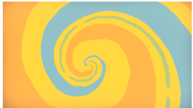
Esprits de Davy Durand