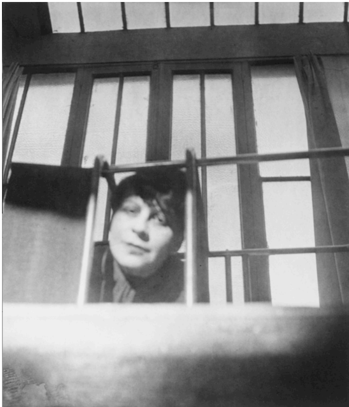
Florence Henri, Autoportrait (à la fenêtre), 1928, 26,8 x 23,1 cm

« Florence Henri Miroir des avant-gardes, 1927-1940 » du 24 février au 17 mai 2015