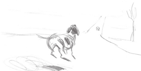
Un jour, un chien

Cabot-Caboche de Daniel Pennac, Poche.Nathan, 1992, page 130