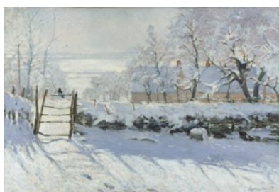
La pie de Claude Monet, 1869