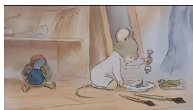
Photogramme du film