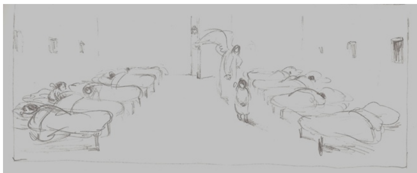
Désordre au Paradis

«Lorsqu'il se réveille, c'est la nuit bleue. Une nuit de pleine lune. D'abord, le Chien ne bouge pas. Trop peur de s'être cassé quelque chose. Et puis, il y a le désespoir. Car il ne lui faut pas beaucoup réfléchir pour admettre l'évidence : il a été abandonné. Volontairement. Comme plusieurs milliers d'autres chiens à l'époque des vacances.»