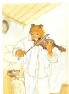
E&C musiciens des rues