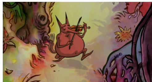
U de Grégoire Solotareff et Serge Elissalde, 2006