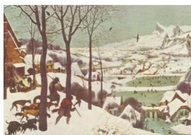
Les chasseurs dans la neige de Pieter Bruegel, 1565