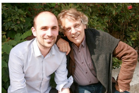
Benjamin Renner et Daniel Pennac