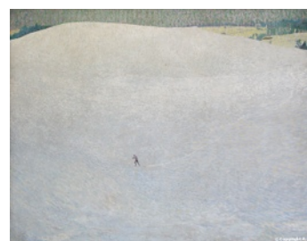
Paysage de neige de Cuno Amiet, 1904