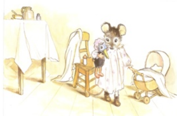
E&C ont perdu Siméon