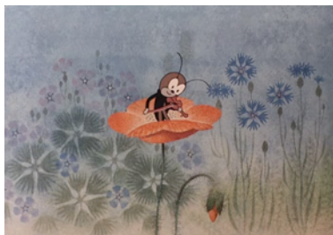
Le criquet et son violon de Zdenek Miler, 1978