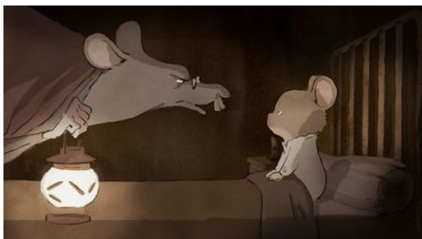
Photogramme du film

Kamo et moi de Daniel Pennac, Gallimard jeunesse, 1992, pages 79 et 80