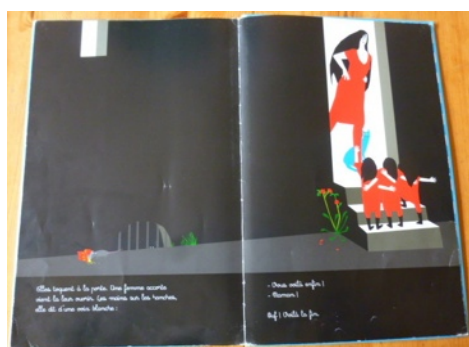
Dudu de Betty Bone, 2005