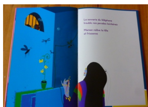
Dudu, coco et nana de Betty Bone, 2008