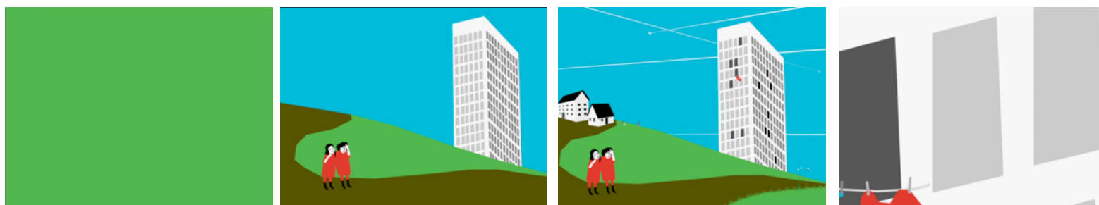
Analyse de la séance en annexe